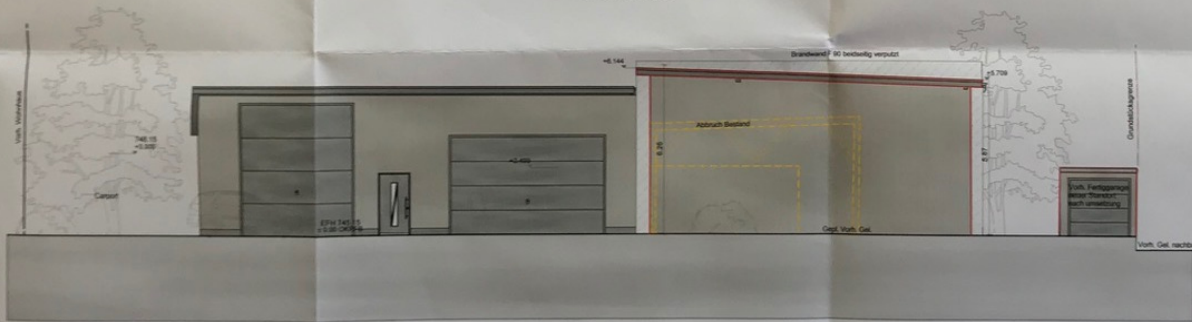
Ostansicht M 1:100