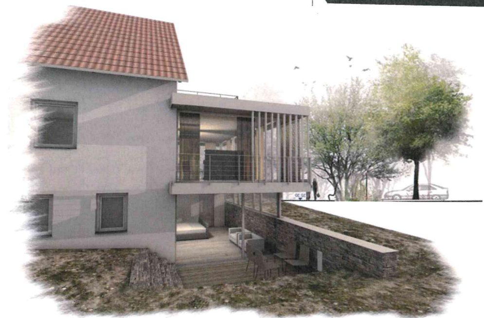
Visualisierung von Norden