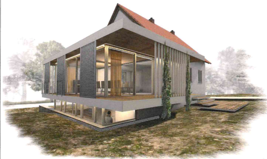
Visualisierung von Süd-Westen